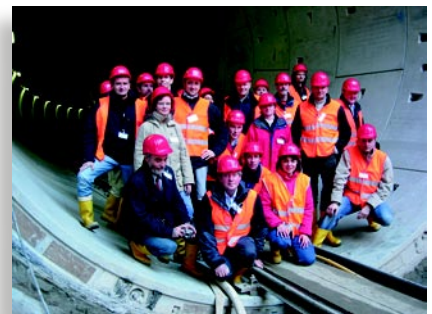
Die Teilnehmer bei der Besichtigung der Baustelle Breslauer Platz der Nord-Süd Stadtbahn.

Der zweite Tag des GEO DIGITAL Anwendertreffens stand ganz im Zeichen der Kölner Nord-Süd Stadtbahn. Mit einer Gesamtlänge von rund 4 km werden derzeit 3,6 km Tunnelstrecke im Schildvortriebsverfahren erstellt. Die Teilnehmer des Anwendertreffens nutzten mit regem Interesse die Möglichkeit, eine Baustelle des derzeit größten städtebaulichen Projekts Deutschlands zu besichtigen.